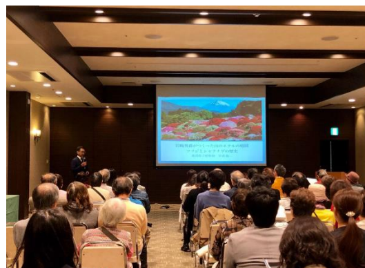
講演会の様子 (イメージ)