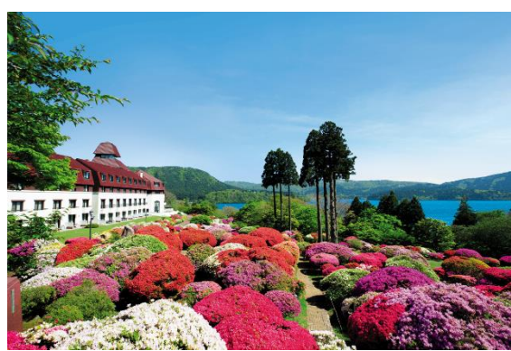
“小田急 山のホテル”のツツジ庭園と芦ノ湖