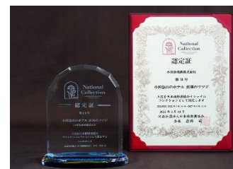
ツツジ認定時の日本植物園協会 ナショナルコレクション認定証と認定盾