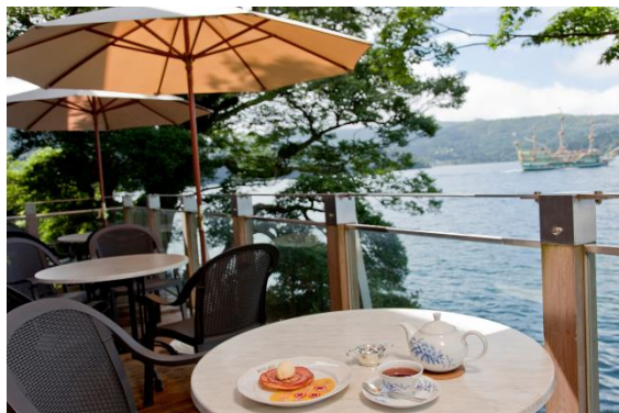
“サロン・ド・テ ロザージュ”のテラス席