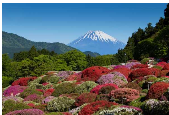
富士山を背景に咲き誇るツツジ

箱根・芦ノ湖畔に建つ“ 小田急 山のホテル ”は 4 月下旬から 「つつじ・しゃくなげフェア 2024」 を開催し、「後世に残すべき植物遺産」と認定を受けた 30 の古品種を含む 84 種類・約 3,000 株のツツジと、42 種類・約 300 株のシャクナゲが開花を迎える庭園をお楽しみいただけます。ここでは壮大な富士山や芦ノ湖をバックに、広大な庭園に色鮮やかなツツジが咲き誇る絢爛たる景色をご覧ください。庭園のツツジは 2022 年に「 日本植物園協会ナショナルコレクション第 10 号 」に認定され、昨年 3 月には、シャクナゲも「 日本植物園協会ナショナルコレクション第 15 号 」に認定されました。今年も、ツツジとシャクナゲがナショナルコレクションに認定されたことと、昨年、ホテルの開業 75 周年を迎えたことを記念して、庭園の歴史なども紹介するツツジ・シャクナゲの小冊子「 小田急 山のホテル 庭園のツツジとシャクナゲ 」を販売いたします。