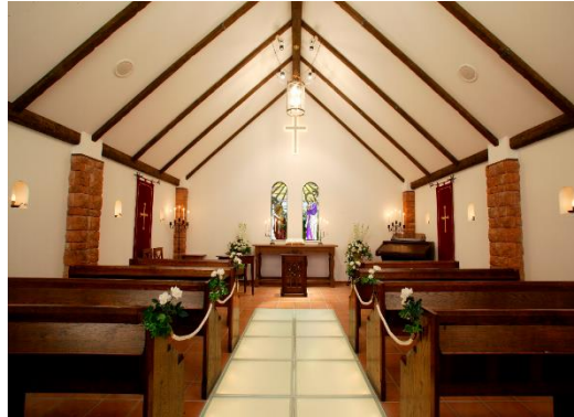
開催場所：“小田急 山のホテル”内 庭園のチャペル