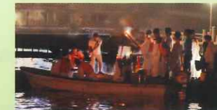
御神火鳥居に点火