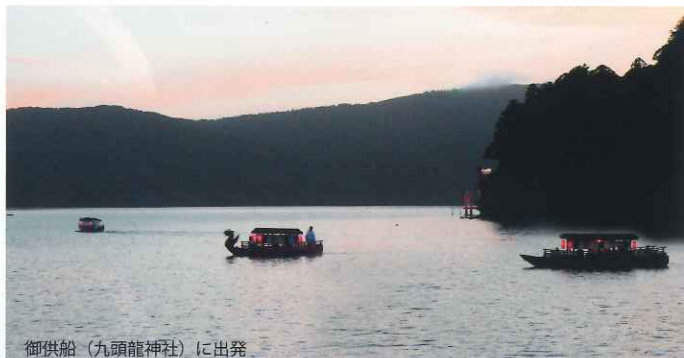
御供船(九頭龍神社)に出発