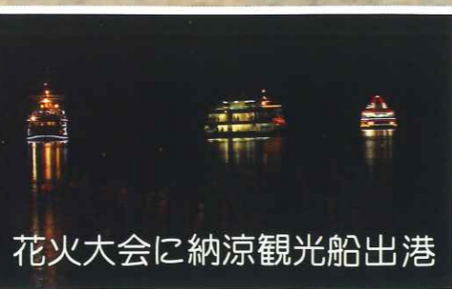
花火大会に納涼観光船出港