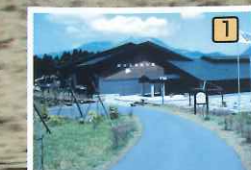
森のふれあい館…館内はファンタジーな森の世界を生みだし、また工作室はこどもに人気があります。