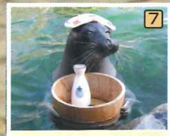
箱根園水族館…大海から湖まで世界中の魚たちが大集合。楽しいイベントも催されます。