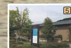
玉村豊男ライフアートミュージアム…生活のテーマを中心に版画や水彩画の作品を展示。ラ・テラツア芦ノ湖は隣接するレストランです。