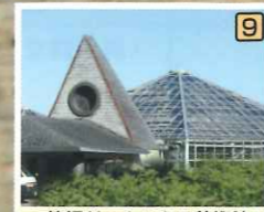
箱根ドールハウス美術館 調度品の一つまで精巧に作られたヴィンテージなミニチュアの世界が展開されています。