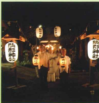
駒形神社から芦ノ湖献火斎場へ向う御神火行列

今でも駒形神社での神事に続き、湖水に浮かぶ大鳥居二基に点火し、大鳥居、花火、灯籠の火影が湖水を美しく彩ります。