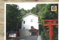
箱根神社宝物館…箱根神社に伝わる宝物類(刀剣・絵画・彫刻・祭具・古文書等)重要資料を各種収蔵してあります。