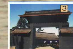
箱根開所・資料館…旧箱根開所を完全復元。大番所には往時の役人の人形、資料館には往時の資料が展示されています。