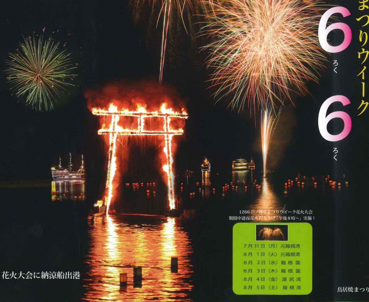
花火大会に納涼船出港

1266 芦ノ湖夏まつりウィーク花火大会 期間中連夜花火打ち上げ「午後8時~」実施!