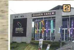
箱根駅伝ミュージアム…日本初の箱根駅伝をモチーフにしたミュージアムです。箱根駅伝の歴史や楽しさを実感できます。